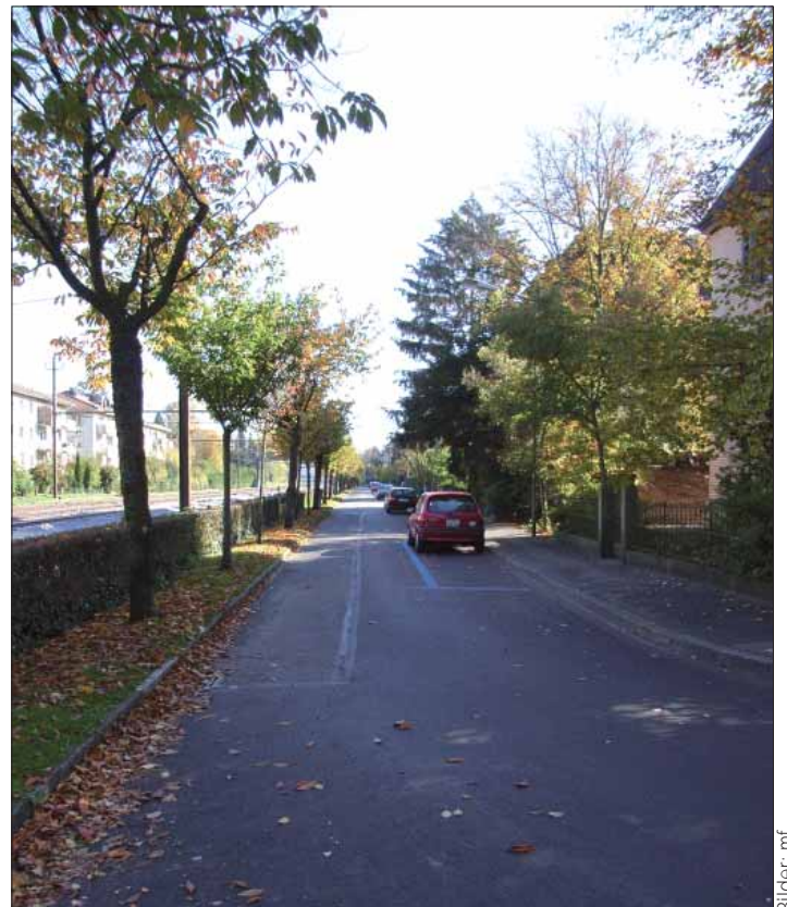
Nicht erfüllt: kein wechselseitiges Parkieren an der Bahnstrasse.