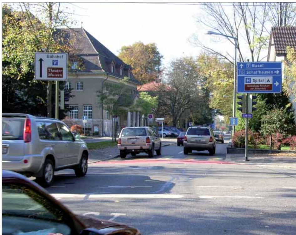
Keine Verbesserung in Sicht: Die untere St. Georgenstrasse ist alles andere als velofreundlich.

• Das Anliegen, das Eingangstor Pflanzschulstrasse auf der Höhe des Altersheims des Brüdervereins solle wie andernorts die Strasse markanter verengen, wurde ebenfalls abgelehnt. Die schmale Variante sei hier gewählt worden, um im Falle einer Kreuzung von Fahrzeugen (z. B. mit Lastenzug) auf