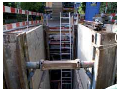
Graben an der Museumstrasse.

Möglich, dass die Eine oder der Andere in einer der lauten Nächte die Schallschutzmauern herbeigesehnt hat. Gewiss, es war eine Belastung, doch die Bauarbeiten haben wir jetzt für längere Zeit wieder hinter uns. Und nicht zuletzt war es auch ein grosses Spektakel! Ich glaube kaum, dass wir besser geschlafen hätten, wenn wir zwar die