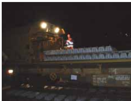
Die Männer der Nacht: ein Gleisarbeiter.

in den amtlichen Publikationen hat es angekündigt: Die SBB erneuern zwischen Hauptbahnhof und Grüze eines ihrer Gleise. Wer schon lange entlang den Gleisen wohnt, weiss, was das bedeutet. Das Ganze beginnt mit einem grandiosen Feuerwerk, dem in Stücke Schneiden der Schienen. Ein Tadam-Tadam begleitet uns die nächsten Tage und erinnert an die Fahrten mit der Rhätischen Bahn. Anschliessend werden parallel zum Trassee neue Schienen verlegt und der eigentliche Ersatz des Gleises vorbereitet. Dann erfolgt der Einsatz der gewaltigen Gleisbaumaschine. Die zersägten Gleisstücke werden aus dem Schotter gehoben und auf dem Bauzug deponiert, das Schotterbett wird ausgebagert und auf den unteren Förderbändern abgeführt. Der hintere Teil des Bauzugs fährt nun bereits auf den neuen Schienen, die von starken pneumatischen Armen in ihre neue, endgültige Lage gepresst wurden. Von diesem Teil des Bauzugs transportiert ein Kran neue Schwellen heran, die in den ausgebagerten Hohlraum unter den Schienen eingefahren werden. Nun wird das Gleisbett mit neuem Schotter