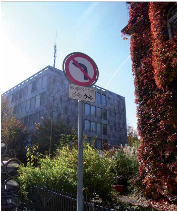
Wunsch erfüllt: neues Linksabbiegeverbot an der Friedenstrasse.

Helfen könnte dabei unsere Forderung, die so genannte «Weisung betreffend die Erteilung von Dauerparkierungsbewilligungen für die Zonen B, C und E im Inneren Lind», die aus den Anfängen der Dauerparkkarten-Geschichte vom 7. Juni 1989 (!) stammt, zu erneuern und den heutigen Gegebenheiten anzupassen! Eine transparente Beschreibung der heute gängigen Pra-