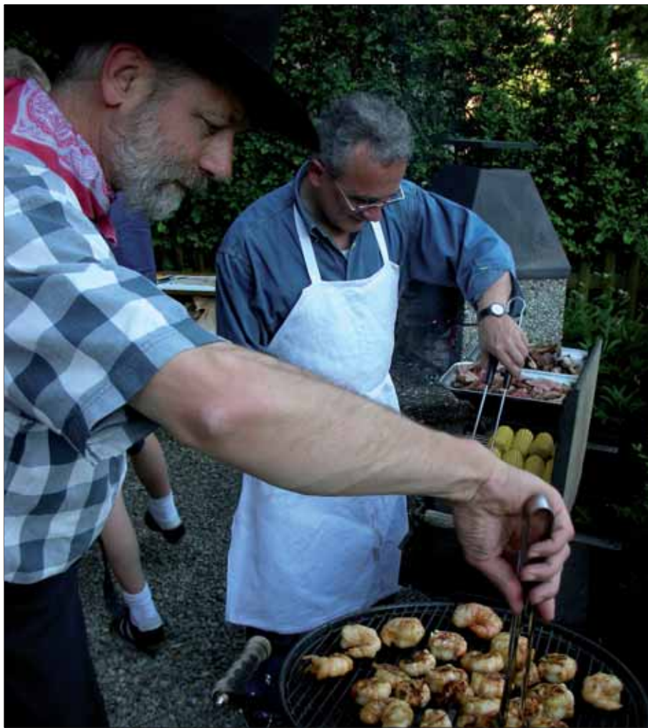
Impressionen von der 1. Barbecue and Country Music Night im Bahnhüsli.