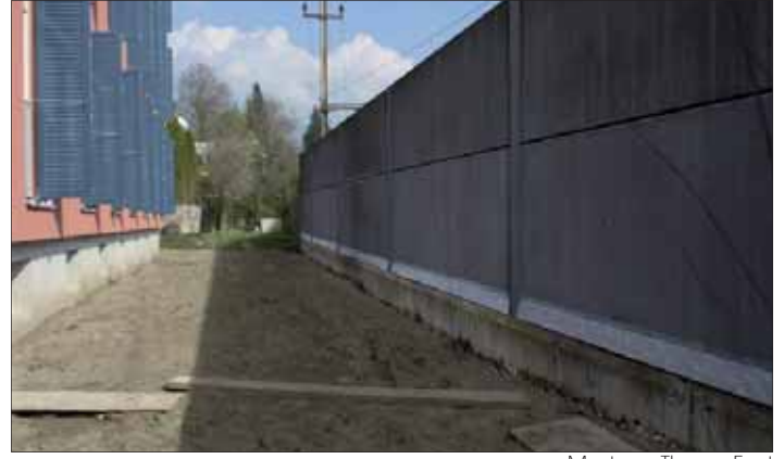
Montage: Thomas Ernst